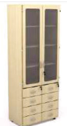
Armário Alto com porta de vidro e 8 Gavetas