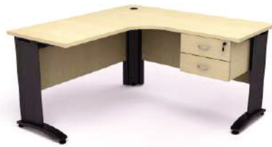
Mesa em «L»