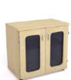
Armário Baixo com Porta de Vidro