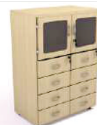
Armário Médio com Portas de Vidro e 8 Gavetas