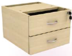
Gaveteiro fixo 2 gav.