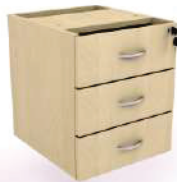
Gaveteiro fixo 3 gav.