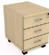
Gaveteiro volante 3 gav.