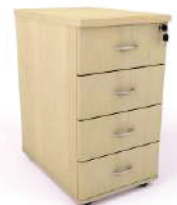
Módulo 4 gav.